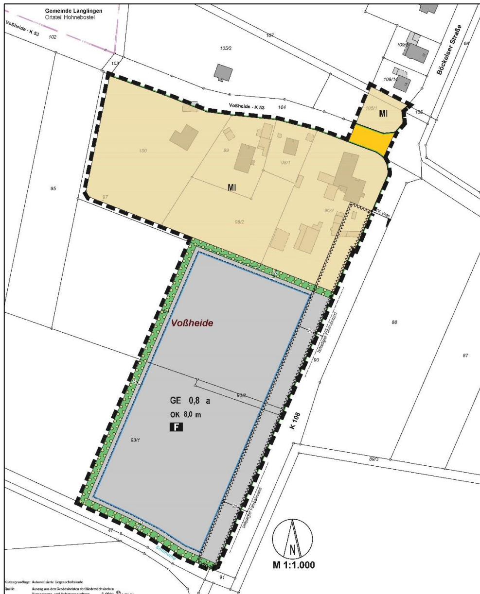
Abb. 2: Entwurf der Planzeichnung zum Baugebungsplan (Ausschnitt)